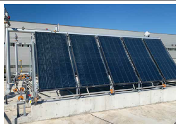
太陽熱集熱パネル