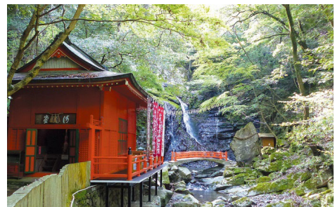
行者の滝